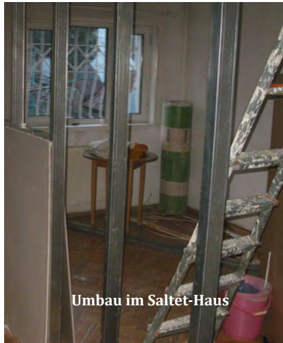
Umbau im Saltet-Haus

Im Rahmen des 40-jährigen Bestehens der Städtepartnerschaft Tbilisi-Saarbrücken hatten das Rathaus und die Stiftung ein Benefizkonzert für die ELKG im Rathausfestsaal organisiert, bei dem saarländische Musiker und die georgische Pianistin auf das Honorar verzichteten, und die Vorstandsmitglieder mit zusätzlicher Arbeit belastete - allen Beteiligten sei