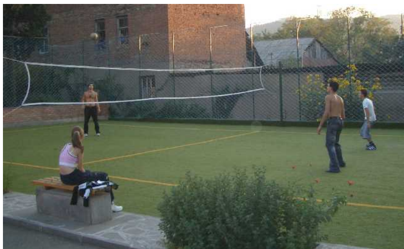
Jugendliche auf dem Volleyballfeld in Tbilisi

Die Gesundheitsfürsorge der Bevölkerung ist ein nationales Problem mit vielen Ankündigungen, Programmen und verschwundenen Geldern. Das bekommen auch unsere beiden Ambulanzen zu spüren. Wer regelmäßig auf vielleicht teure Medikamente angewiesen ist, braucht unsere Hilfe. Viele Erkrankungen hängen mit der Not, Arbeitslosigkeit, den Spannungen in den Familien