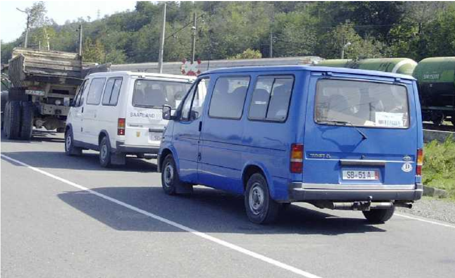
Die Busse für Georgien auf dem Weg