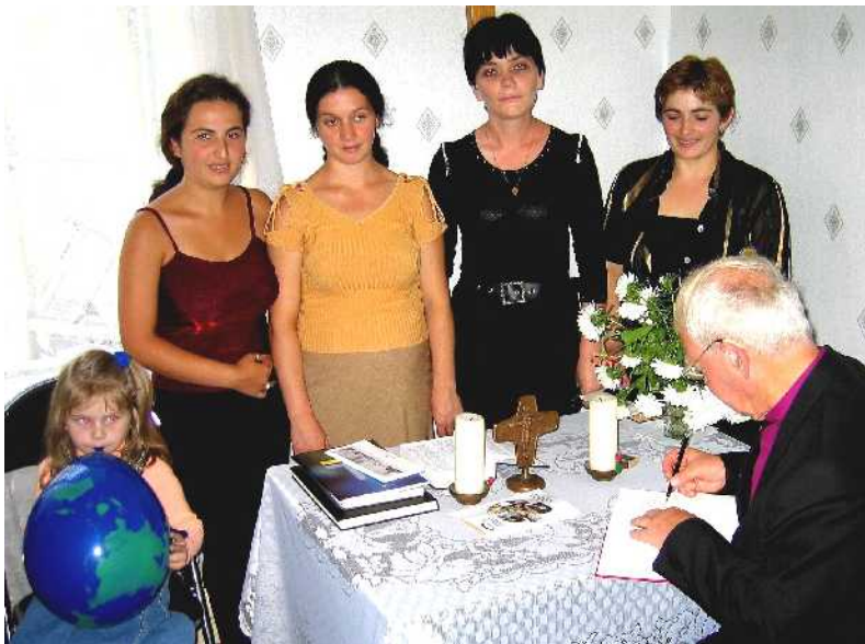
Bischof Maier trägt sich in das Gästebuch von Gadarbani ein

Bis man in Gadarbani ist, werden die Stoßdämpfer des Autos auf eine harte Probe gestellt. Über unzählige Schlaglöcher gelangt man von der georgischen Hauptstadt Tiflis in das rund vier Fahrstunden entfernte Dorf Gadarbani nahe der armenisch-aserbaidschanischen Grenze. Doch die Fahrt hat sich gelohnt. Die württembergische Delegation wird mit großer Freude empfangen. Die drei Gemeindevorsteherinnen haben den Gemeinderaum schön hergerichtet, damit man auch wochentags einen Eindruck davon erhält, wie die kleine Hausgemeinde mit derzeit 15 Mitgliedern sonntags den Gottesdienst feiert. Vor drei Monaten zählte die Gemeinde noch 17 Erwachsene. Aber mittlerweile sind zwei in den Westen ausgewandert. Zu den übrig gebliebenen 15 Erwachsenen kommen noch fünf Kinder dazu. Das Haus, in